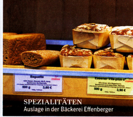
SPEZIALITÄTEN Auslage in der Bäckerei Effenberger