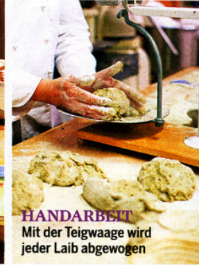
HANDARBEIT Mit der Teigwaage wird jeder Laib abgewogen