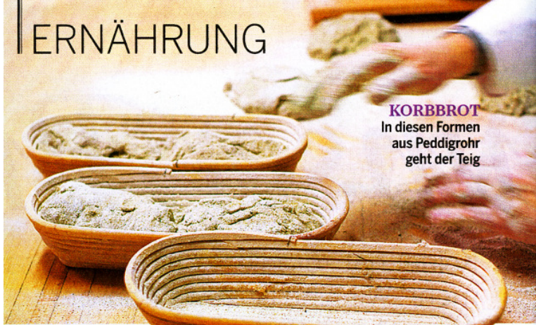
KORBROT In diesen Formen aus Peddigrohr geht der Teig